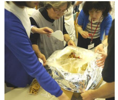
非常食かやくご飯試食