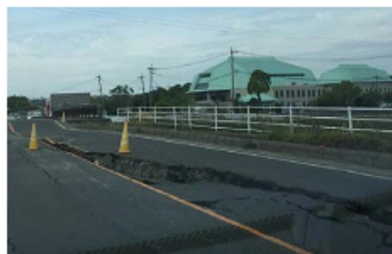
道路には亀裂が入り、交通網を寸断している

—みなさまの基金は、日本YMCA同盟を通じて熊本地震緊急支援活動（避難所運営、現地コーディネーター派遣、被災YMCAの再建・運営など）に用います—