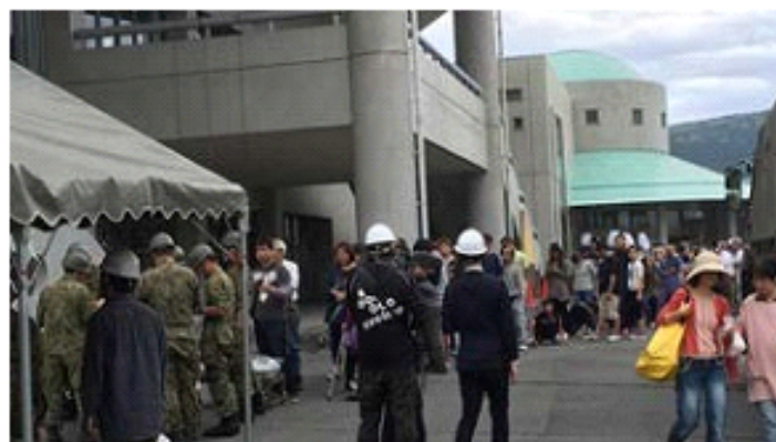
右後方、緑の屋根が、避難所となっている「益城総合運動公園・体育館」