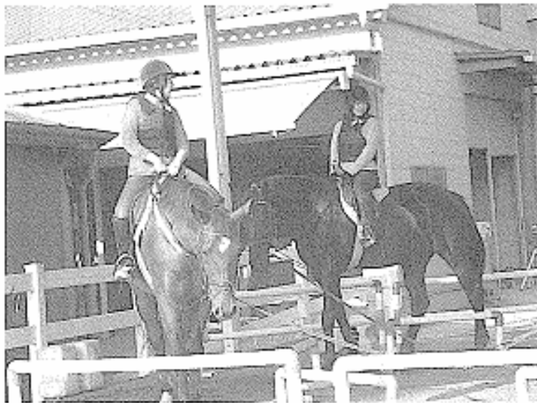
ホースライディング (馬とふれあう貴重な体験です)