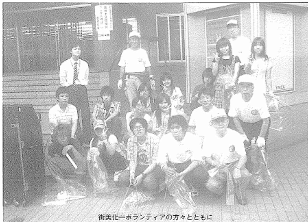
街美化ボランティアの方々とともに