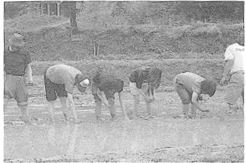
農業体験 (紀泉わいわい村にて)

の学校を好きな理由のひとつです。また、普段体験できないような「ヨーガ」、「海洋スポーツ」、「保育実習」などの授業を受講し、教師を目指している私にとって貴重な体験になりました。