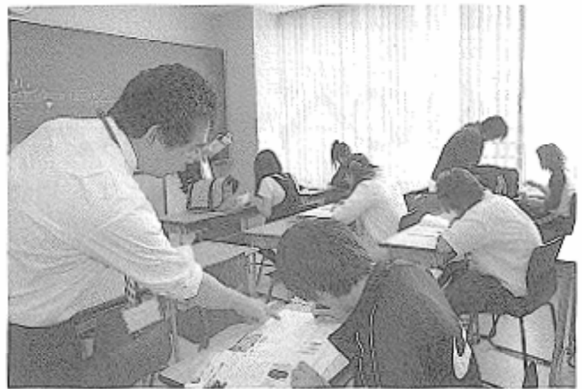
アシスト・プログラム (レポート作成の支援)