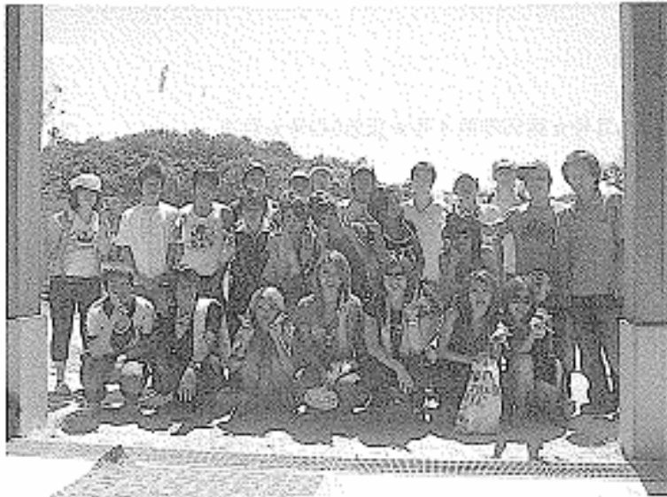
海洋スポーツ (シーマンシップを学びます)